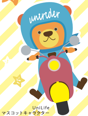
UniLife マスコットキャラクター 「ユニライダー」