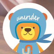
ユニライフマスコットキャラクター「ユニライファー」