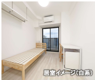
居室イメージ(白系)

R8年1月完成・鉄筋地上13階地下1階・全309室・総合補償要・兵庫県神戸市中央区港島中町6