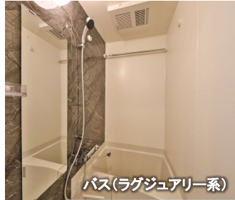
バス(ラグジュアリー系)