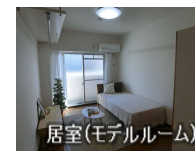
居室(モデルルーム)