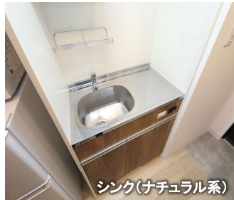
シンク(ナチュラル系)