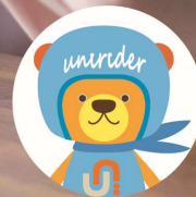
ユニライフマスコットキャラクター「ユニライダー」